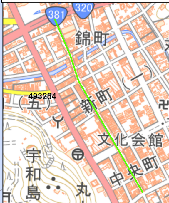
都市設備LOD3整備範囲